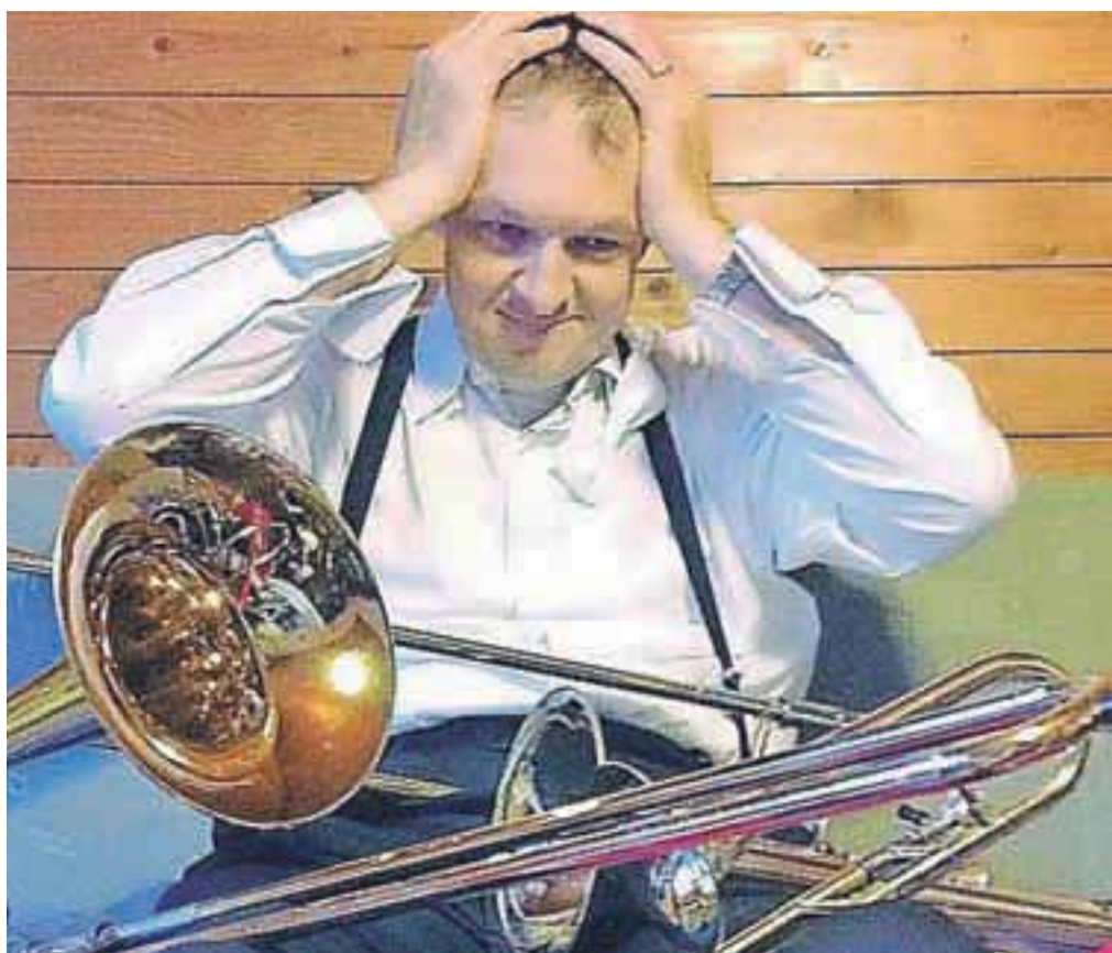
Že vrsto let je vrhunski slovenski glasbenik, pravi virtuoz v igranju na pozavno.