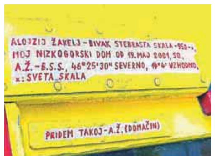
Jeseniški grad ni namenjen množičnemu obisku, ampak predvsem planincem, ki iščejo mir sredi neokrnjene narave.