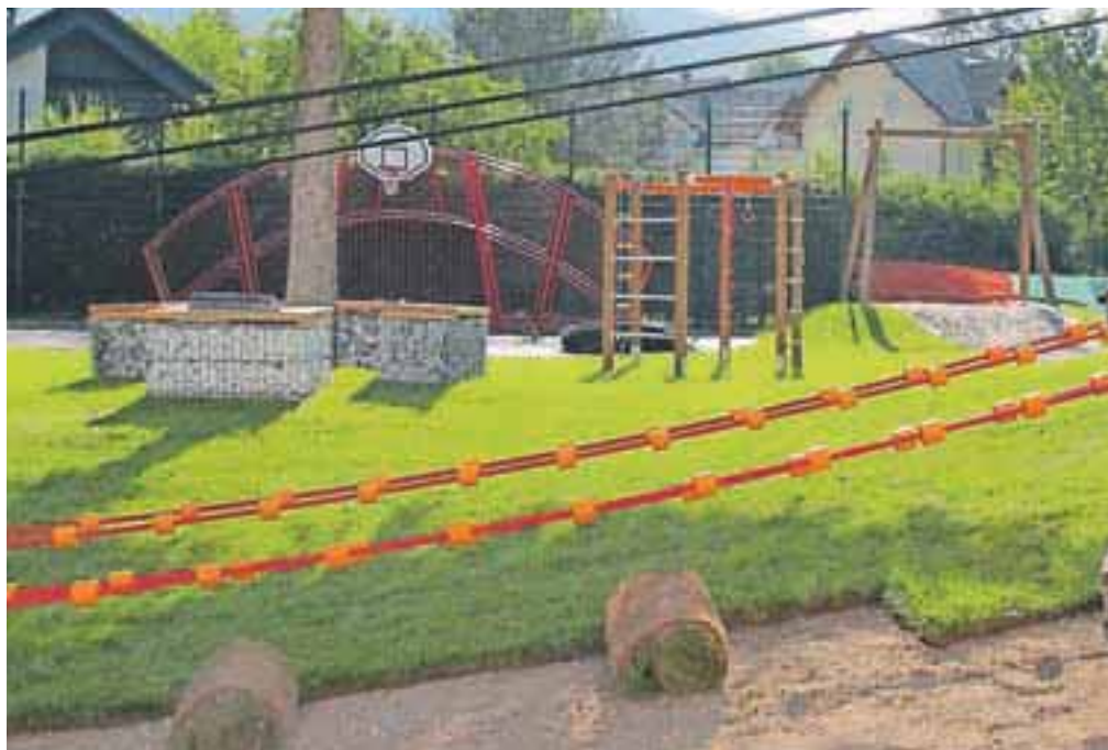
Novo otroško igrišče na Javorniku, del denarja za opremo je prispevala tudi država.

Na Slovenskem Javorniku so v začetku meseca odprli novo otroško igrišče, ki so ga uredili poleg igrišča, ki je tam od leta 2009. A če je bilo dosedanje otroško igrišče namenjeno predvsem mlajšim otrokom, je novo igrišče primerno za večje, osnovnošolske otroke. Na igrišče so namestili žičnico, vrvi most, šestkotno igralo, element koš-gol, uredili pa so tudi preostalo opremo, kot so koši, stojala za kolesa in klopi. Skupaj s parkirnimi površinami je novo igrišče veliko 750 kvadratnih metrov. Projekt je Občina Jesenice vključila v nabor projektov Leader LAS Gorenjska košarica, ureditev je stala nekaj manj kot 64 tisoč evrov, od tega jim je uspelo pridobiti okrog deset tisoč evrov sofinanciranja s strani ministrstva za kmetijstvo in okolje. Otroško igrišče so na Slovenskem Javorniku dobili leta 2009, ko je Občina Jesenice odkupila dve parceli, na katerih je bila predvidena gradnja dveh stanovanjskih