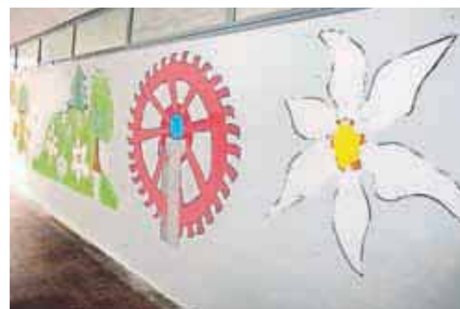
Stene podhoda so poslikali z jeseniškimi motivi, kot so narcise, hokej ter motivi EuroBasketa 2013.