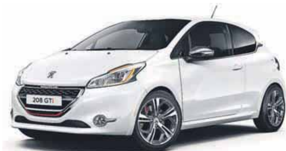
Peugeot 208 GTi najprej očara s svojim zvokom!

147 kW (200 KM) ima 208 GTi prvovrstne hitrosti in pospeške. Hitrost od 0 do 100 km/h doseže v manj kot 7 sekundah, razdaljo od 0 do 1000 m prevozi v 27 sekundah. Enako dobri so pospeški, 208 GTi pospeši z 80 na 120 km/h v manj kot 7 sekundah, in to v 5. prestavi. 208 GTi je vesel športnik, zmogljiv in zanesljiv, z očarljivim zvokom, dvojnik odlične limuzine, stroj, ustvarjen za največje ljubitelje športne vožnje.