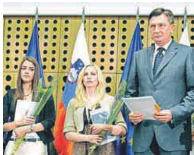
Na podelitvi priznanj na Brdu pri Kranju s predsednikom države Borutom Pahorjem

kako z majhnimi koraki lahko delaš velike stvari, in to doma. »Zelo veliko prostovoljcev bi rado reševalo afriške sirote in dobilo izkušnjo potovanja. Ne zavedamo pa se, da se je z dobrodelnostjo in humanitarnostjo treba začeti ukvarjati doma,« poudarja Faila.