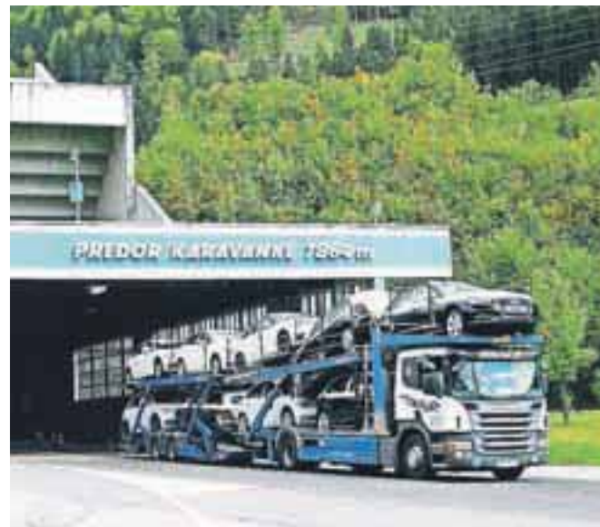
Predor Karavanke je edini enocevni avtocestni predor v Sloveniji. Gradnja druge cevi naj bi bila najboljša dolgoročna rešitev problema prometne varnosti.