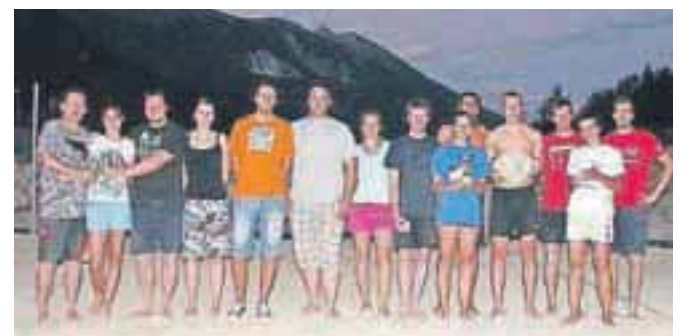
Udeleženci uvodnega turnirja

Mencinger, ki je bil odgovoren tudi za prvi odboj žoge. Prvega turnirja v odbojki na mivki na Jesenicah se je udeležilo pet ekip, igrali pa so po sistemu vsak z vsakim. Končni vrstni red je sledeči: 1. Sestreljeni jastrebi, 2. Brežani, 3. MRM, 4. Jack, 5. Kamnolom.