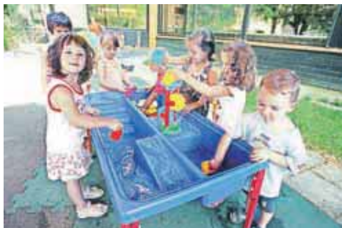
Zabaven vodni kotiček v vrtcu na Plavžu

Od 660 malčkov, ki obiskujejo Vrtec Jesenice, jih je bilo tudi med poletnimi počitnicami v vrtcu okrog 150. Odprti sta bili dve enoti vrtca, na Plavžu in na Koroški Beli. Zaposleni v vrtcu so poskrbeli, da so se otroci tudi v vročih poletnih dneh imeli lepo. Tako so jim na vrtčevskem igrišču na Plavžu postavili indijansko vas s šotorčki in uredili vodne koticke, v katerih so se otroci zabavali z vodo. Vzgojiteljice so v najbolj vročih dneh otroke odpeljale tudi v gozd in k potoku, da so laže prenašali vročino. Podobno so v vrtcu na Koroški Beli poletje izkoristili za igre z vodo, veliko petja, plesa in smeha. U. P.