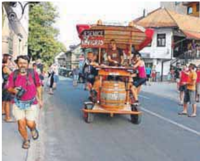
Ekošank na pogon desetih kolesarjev se je 7. avgusta ob sedmih zvečer takole odpravil z Jesenic.