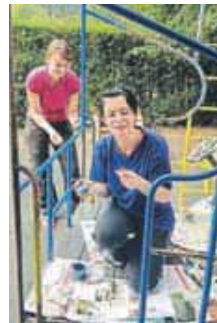
Prostovoljke in prostovoljci ob barvanju igral pri vrtcu na Plavžu.