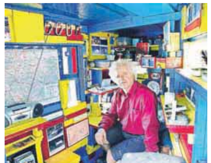
Vsak detalj v bivaku, od svetih podob, fotografij do ur in Žakljevega dnevnika, ima svojo zgodbo.